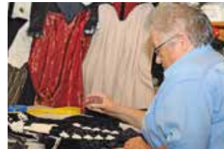
3 Trachtenschneiderei Reist

Reist-Örgeli Dorfstrasse 35 Wasen i.E. www.reist-oergeli.ch