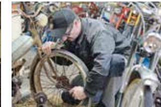
5 Töffli-Oldtimer-Bude Fleusi

Käseerei Fritzenhaus Fritzenhaus Wasen i.E. www.kaeserei-fritzenhaus.ch