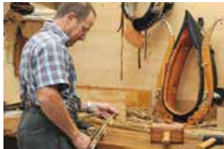
1 Sattlerei Blaser

Die Betriebe sind, mit Ausnahme der Käseerei im Fritzenhaus, innerhalb von fünf Minuten zu Fuss erreichbar. Die Käseerei Fritzenhaus ist mit dem Auto in knapp zehnminütiger Fahrt ab Wasen erreichbar.