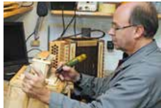
2 Schwyzerörgli-Manufaktur Reist

Sattlerei Blaser GmbH Dorfstrasse 41 Wasen i.E. www.blaser-sattlerei.ch