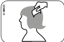
Resim: Islak saçın bit tarağı ile saç kökünden uçlarına kadar taranması