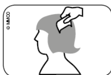
Imagem: Passar o cabelo molhado a pente fino, com um pente para piolhos, da raiz até à ponta dos cabelos.